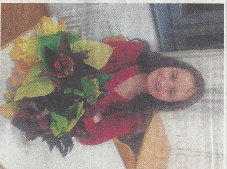
Delavnica izdelovanja jesenskih rož iz naravnih materialov v DD ŠCRS