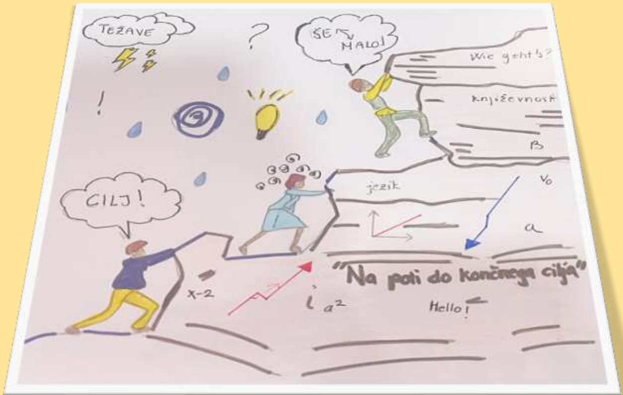
Mediha Saliji, 1. a